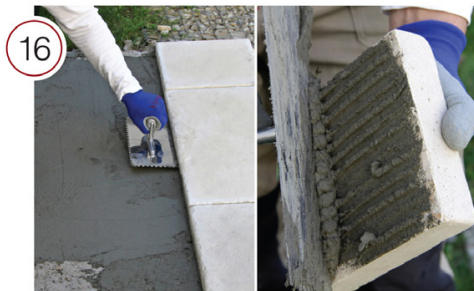
Нанесите гладким шпателем клеевой раствор на поверхность основания и на тыльную сторону элементов брусчатки. Разровняйте зубчатым шпателем. Приложите к основанию и, прижав, слегка подвигайте элемент из стороны в сторону, чтобы обеспечить наилучшее сцепление.