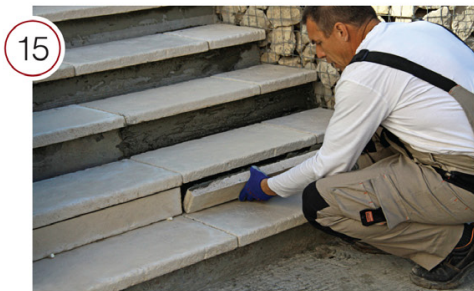
Нанесите гладким шпателем клеевой раствор на тыльную сторону подступенка. Разровняйте клей зубчатым шпателем. Приложите к основанию и, прижав, слегка подвигайте элемент из стороны в сторону, чтобы обеспечить наилучшее сцепление.