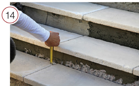
Произведите замеры подступенка и, при необходимости, подрезку.