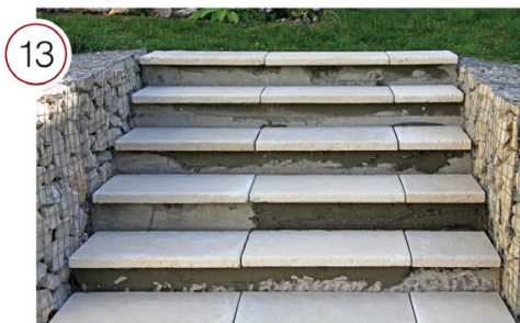
Общий вид без подступенков.