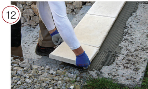
Нанесите гладким шпателем клеевой раствор на тыльную сторону подрезанной ступени. Разровняйте зубчатым шпателем. Приложите ступень к основанию и, прижав, слегка подвигайте из стороны в сторону, чтобы обеспечить наилучшее сцепление. Используйте резиновую киянку.