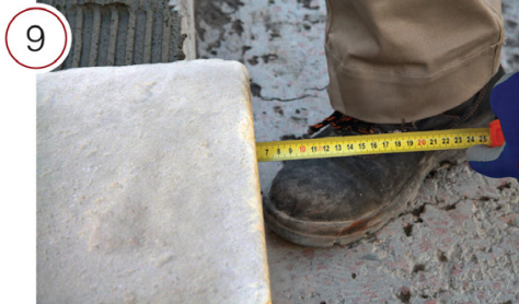
В готовом виде, после приклеивания подступенка, вылет составит 1 см.