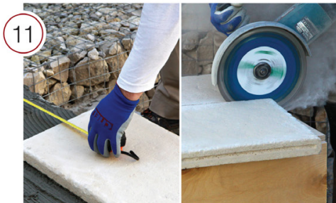
Произведите замеры и, при необходимости, подрезку следующего укладываемого элемента ступени.