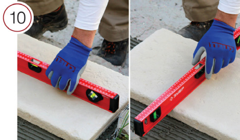
С помощью уровня проверьте наличие небольшого уклона при укладке ступени в направлении спуска.